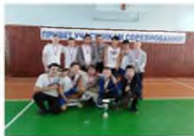
Команда баскетболистов филиала № 2, г. Новосиль

Баскетбольная команда юношей филиала № 2 заняла первое место в первенстве Новосильского района и была награждена Дипломами и Кубком победителей. А 13 декабря 2018 г. в рамках декады борьбы со СПИДом в